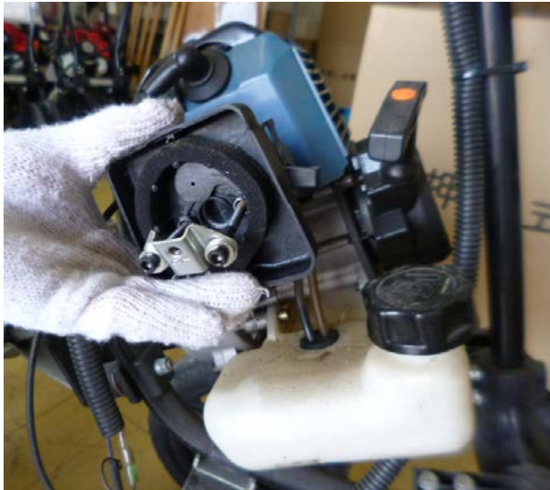
エアクリナー 取外し