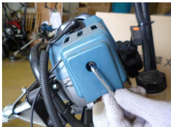
六角棒レンチにて ボルト(1ヶ所)を 取外す