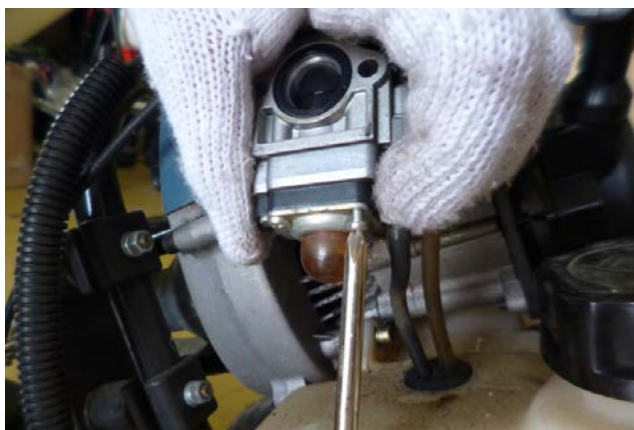
ドライバーにて ボルト(4ヶ所)を 取外す