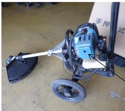
エアクリナーカバー