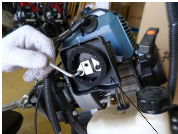
六角棒レンチにて ボルト(2ヶ所)を 取外す