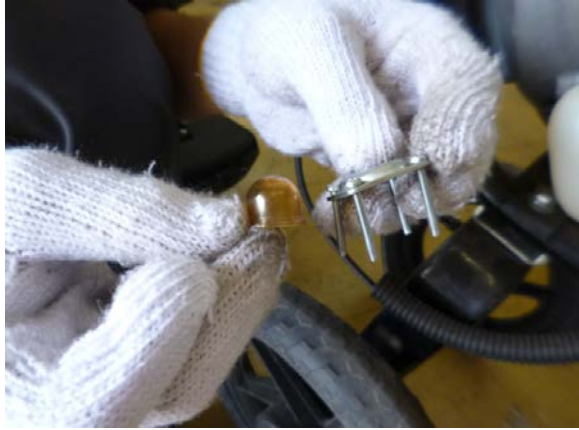
プライマリーポンプ 取外し