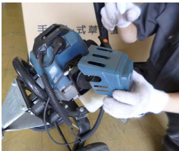
エアクリナーカバー 取外し