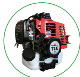
三菱メキエンジン 2サイクル 33 cc