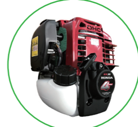
ホンダエンジン 4サイクル 35 cc