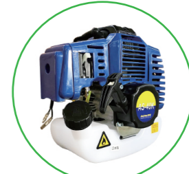
VIVy オリジナル 2サイクル 43 cc