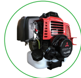
三菱メキエンジン 2サイクル 43 cc